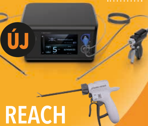
REACH 2 in 1 ultrahangos vágó és ligasure generátor