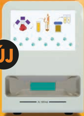
AI 100 VET morfológiai minilabor vér-bélsár-vizelet elemzéséhez