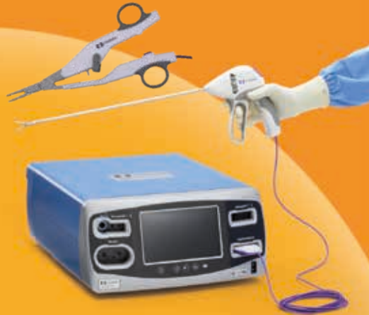
LIGASURE FORCETRIAD 3 in 1 mono-bipol ligasure generátor