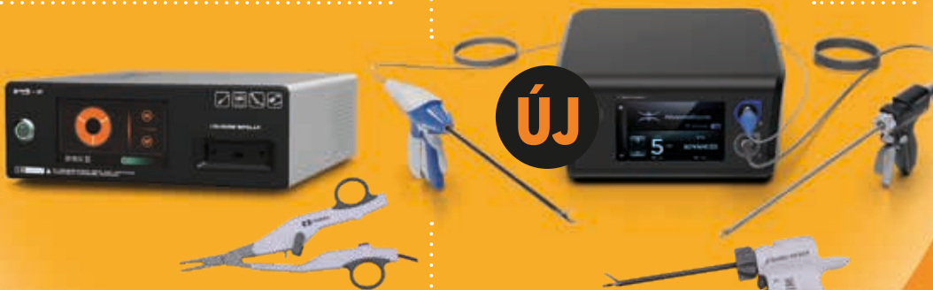
SUPERVET XP ligasure generátor